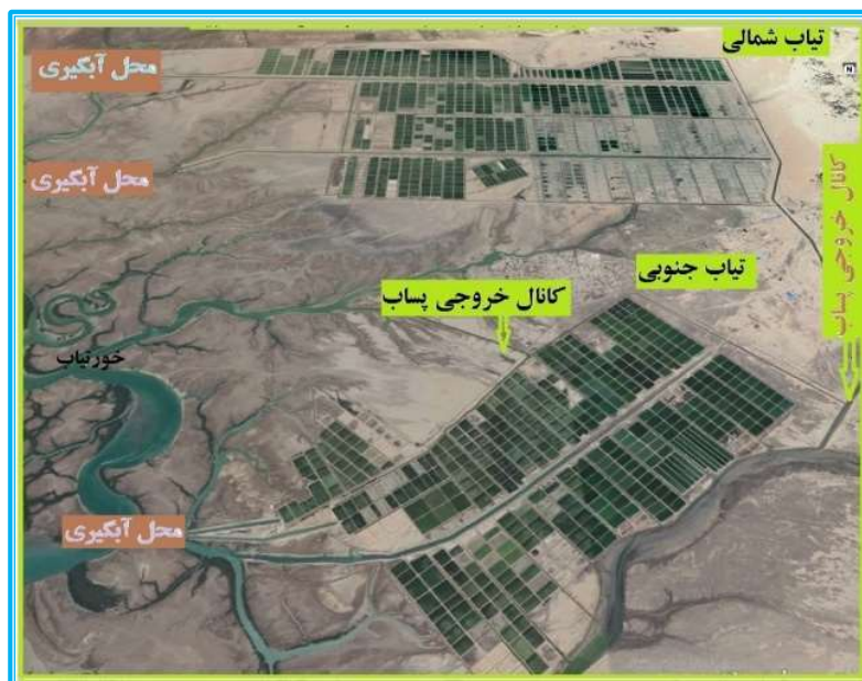
شکل ۱. نمایی از موقعیت سایت‌های پرورش میگو در منطقه تیاب واقع در شهرستان میناب استان هرمزگان